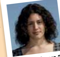
amb el número 3