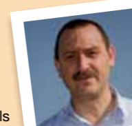
amb el número 21

Col.labora a Ràdio Molins de Rei, Els Pastorets, i fa activitats amb un gran nombre d'entitats de la Vila. És voluntari per la Llengua i va ser membre actiu de Molins Decideix.