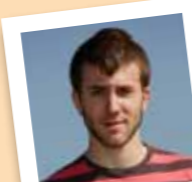
amb el número 11