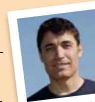
amb el número 17

A sigut membre de l'Agrupar, els Amics del Camell, soci de l'Ateneu Mulei, Impuls i Els Pastorets