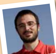
amb el número 4

Membre de la Comissió Focs de Sant Joan, C.A.J La Mola, presentador de l'Altraveu, Molins Decideix, soci de l'Agrupació Folklòrica i de l'Ateneu Mulei.