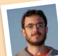
amb el número 20

És sòcia dels Amics del museu des de fa molts anys i de 1968 a 1982 va jugar a handbol al primer equip femení que es va formar a Molins de Rei.