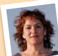
amb el número 7

Ha col.laborat amb els Matossers, bastoners, Esp-lai l'Agrupar i Casal de Joves La Mola. Actualment col.labora amb l'Esbart Dansaire i el Mulei.