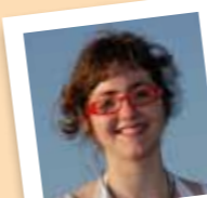
amb el número 22

Col.labora a l'Esp-lai l'Agrupar, a la Colla gegantera, els Amics del Camell, els Amics dels pessebres i l'Ateneu Mulei.