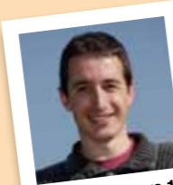
amb el número 1

Va ser delegada de personal de CCOO de 1996 al 2006 en el servei de neteja municipal.