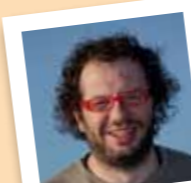
amb el número 30

És monitora de l'Esp-lai, va formar part de l'assemblea del CAJ la Mola i ara hi col.labora esporàdicament.