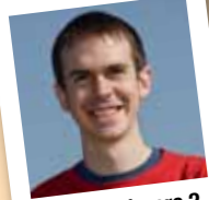
amb el número 2