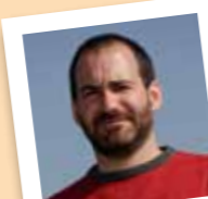
amb el número 15

Ha col.laborat a l'Esp-lai l'Agrupar, CEPA, CAL (Coordinadora d'Associacions per la Llengua), Els Pastorets, i actualment col.labora a l'Ateneu Mulei i Els Amics del Camell.