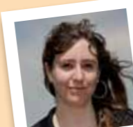
amb el número 9

Actualment és sòcia del CEM i participa de les caminades que s'hi organitzen.