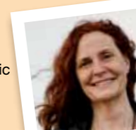
amb el número 31