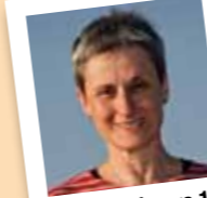
amb el número 18

Ha col.laborat amb Diables i l'Esp-lai l'Agrupar, els Matossers i el CEPA. Actualment, col.labora amb el Mulei, l'Esp-lai D-sastre i el de circ dins el CAJ La Mola, i amb 'VaToquem'.