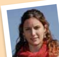
amb el número 28

Ex-membre del A.E. Jaume Vicens Vives (CAU) i dels Amics del Camell.