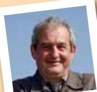
amb el número 6

Membre de l'Ateneu Mulei, Amics del Camell, Molins Decideix, Els Pastorets i La Passió.