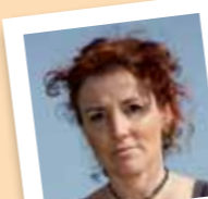
amb el número 24

Col.labora en una entitat de Barcelona -Amics de la Gent Gran- visitant una àvia una tarda a la setmana.