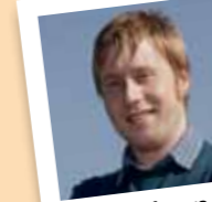
amb el número 19

Col.labora amb entitats com l'Ateneu Mulei, Amnistia Internacional o Motards Independentistes.