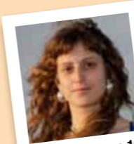
amb el número 16

Assemblea Popular de Molins de Rei, Comissió de Festa Major.