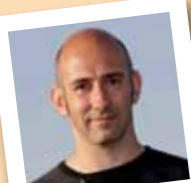
amb el número 8

És portantveu de la Plataforma 'Salvem del Foc Collserola', col.laborador de l' ADF (Associació de Defensa Forestal) i 2n entrenador de l'equip juvenil del Molins de Rei CF.