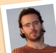
amb el número 13