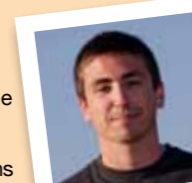
amb el número 25

Ha militat a l'MDT a Cornellà, ha participat en estades solidàries al Marroc amb l'ONG So de Pau de la qual n'és soci, ha estat Voluntari per la Llengua a Molins i ha fet Sortides amb el Club Ciclista Cornellà.