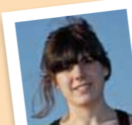
amb el número 26

Ha col.laborat al Festival de Cinema de Terror de Molins de Rei, ha estat ex- secretària del Cercle Artístic entre 2009 i 2010 i actualment és grillera de Matossers.