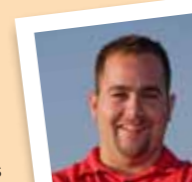
amb el número 27

Participa activament al CAU, a l'Assemblea de facultat de Física, amb el projecte Güifi.net, és entrenador d'handbol al C.E. Molins, va participar activament al Molins Decideix.