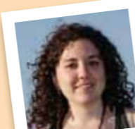
amb el número 5

Membre de l'Assemblea Popular de Molins de Rei, Comissió de Festa Major