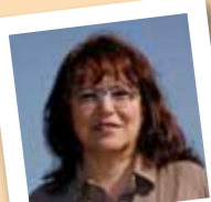
amb el número 14

Membre de Matossers. Va col.laborar, en el projecte de Comerç Just i va acollir un nen del Sàhara. Socia de l'Ateneu Mulei i d'AFNE. Ha fet de parella lingüística.