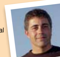
amb el número 23

Pertany a l'Associació de donants de sang del Baix Llobregat. Va militar en els Comitès Solidaritat Patriotes Catalans, en els Col·lectius Antirepressius, en el Grup Ecologista de Cornellà i en la CNT.