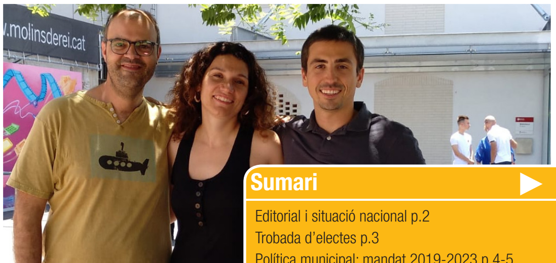
El nou equip de regidors sortint de les eleccions de maig 2019